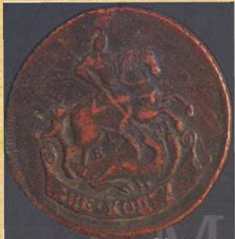
Медная монета Екатеринбурга