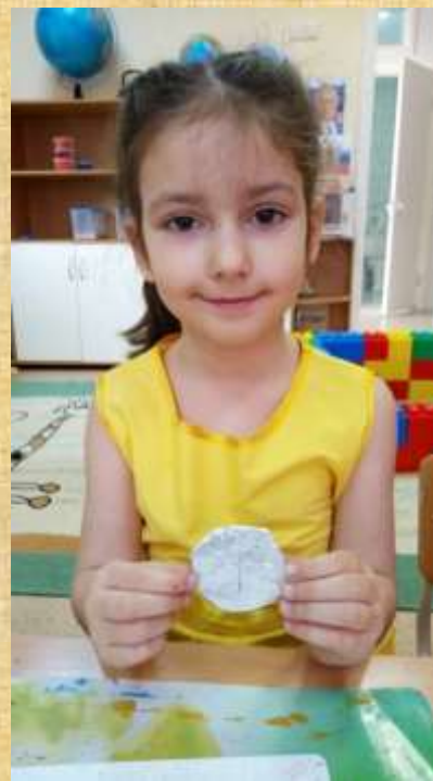
Наша коллекция монет