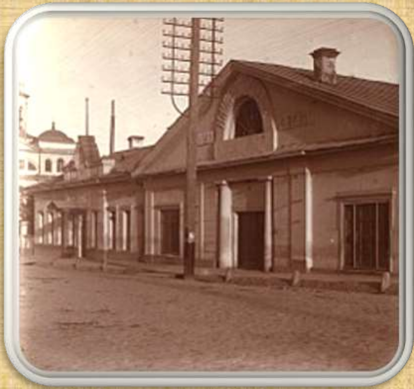
И м п е р а т о р с к а я г р а н и л ь н а я ф а б р и к а