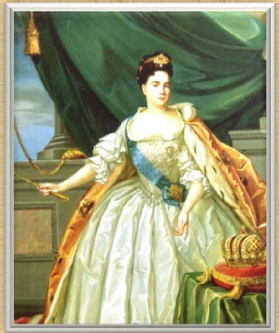
Екатеринбург был назван в честь императрицы Екатерины Первой