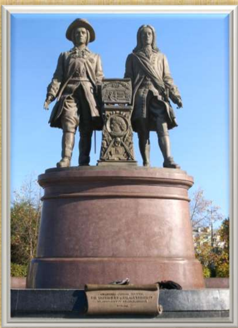
Основатели Екатеринбурга – Василий Татищев (справа) и Вильгельм де Генин (слева)